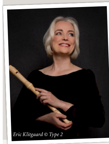
Eric Klitgaard © Type 2